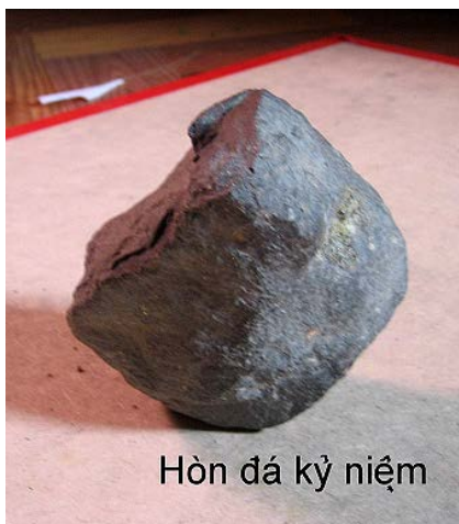
Hòn đá kỷ niệm

Bỗng bộp một phát. Chưa kịp hiểu ra chuyện gì thì vợ tôi ngã lăn ra, bát cơm rơi vỡ tung toé. Bà Lý ôm lấy vợ tôi. Còn tôi theo linh tính ngó vội ra cửa, vừa lúc phát hiện một thanh niên từ phía tủ lạnh trong nhà tôi chạy vụt ra ngoài. Tôi gọi giật lại, anh ta phân bua: Cháu bị nó ném, không hiểu sao nó ném.